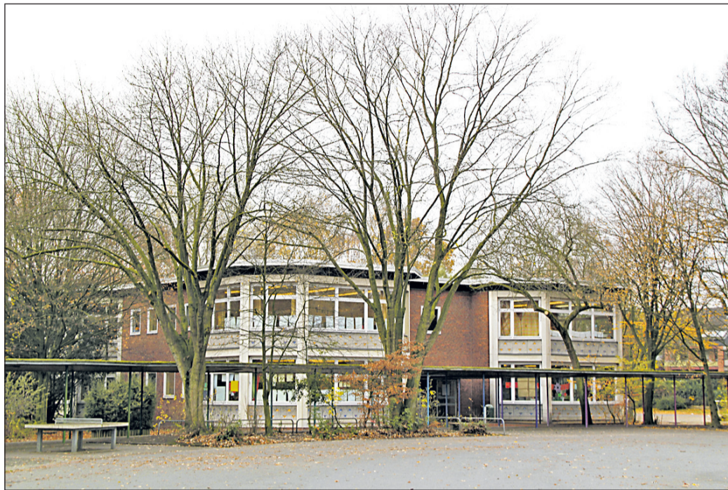
Ein Teil der Grundschule Halmer Weg