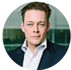
Dr. Konstantin von Notz Stellvertretender Fraktionsvorsitzender – Beauftragter für Religion und Weltanschauungen