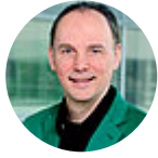
Dr. Wolfgang Strengmann-Kuhn Sprecher für Arbeitsmarktpolitik und europäische Sozialpolitik