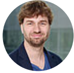
Sprecher für Kulturpolitik Stefan Gelbhaar Sprecher für Verkehrspolitik und Radverkehr