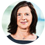
Katrin Göring-Eckardt Fraktionsvorsitzende