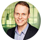
Kai Gehring Sprecher für Forschung, Wissenschaft und Hochschule