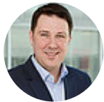
Markus Tressel Sprecher für Ländliche Räume und Regionalpolitik – Sprecher für Tourismuspolitik