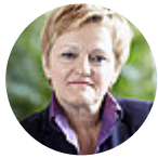
Renate Künast Sprecherin für Ernährungspolitik – Sprecherin für Tierschutzpolitik