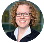
Dr. Julia Verlinden Sprecherin für Energiepolitik