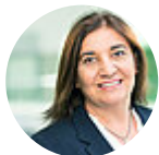
Ekin Deligöz Sprecherin für Kinder- und Familienpolitik