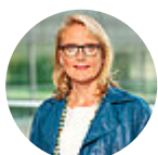
Lisa Paus Sprecherin für Finanzpolitik